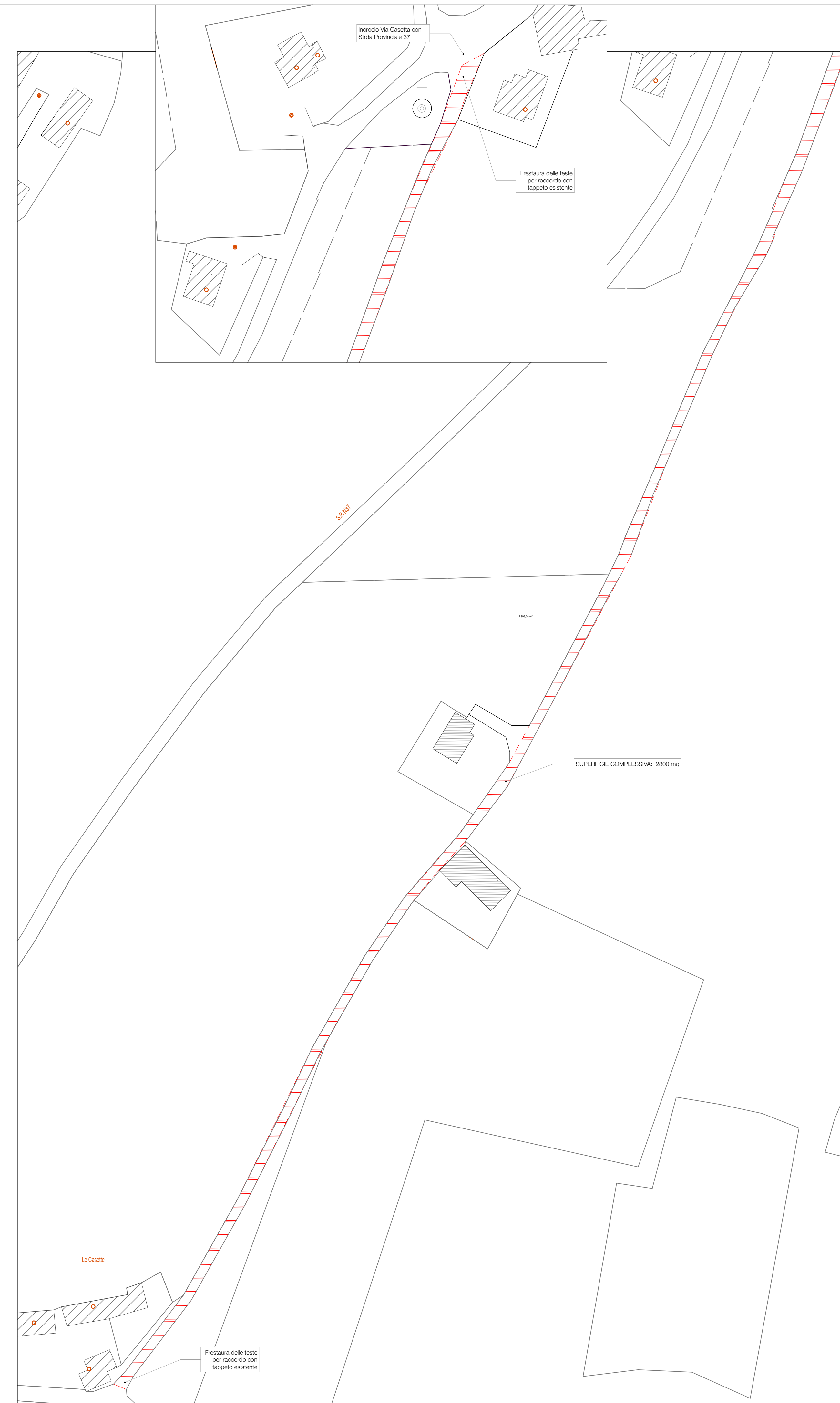
Estratto CTR _ scala 1:1000 individuazione superficie di intervento