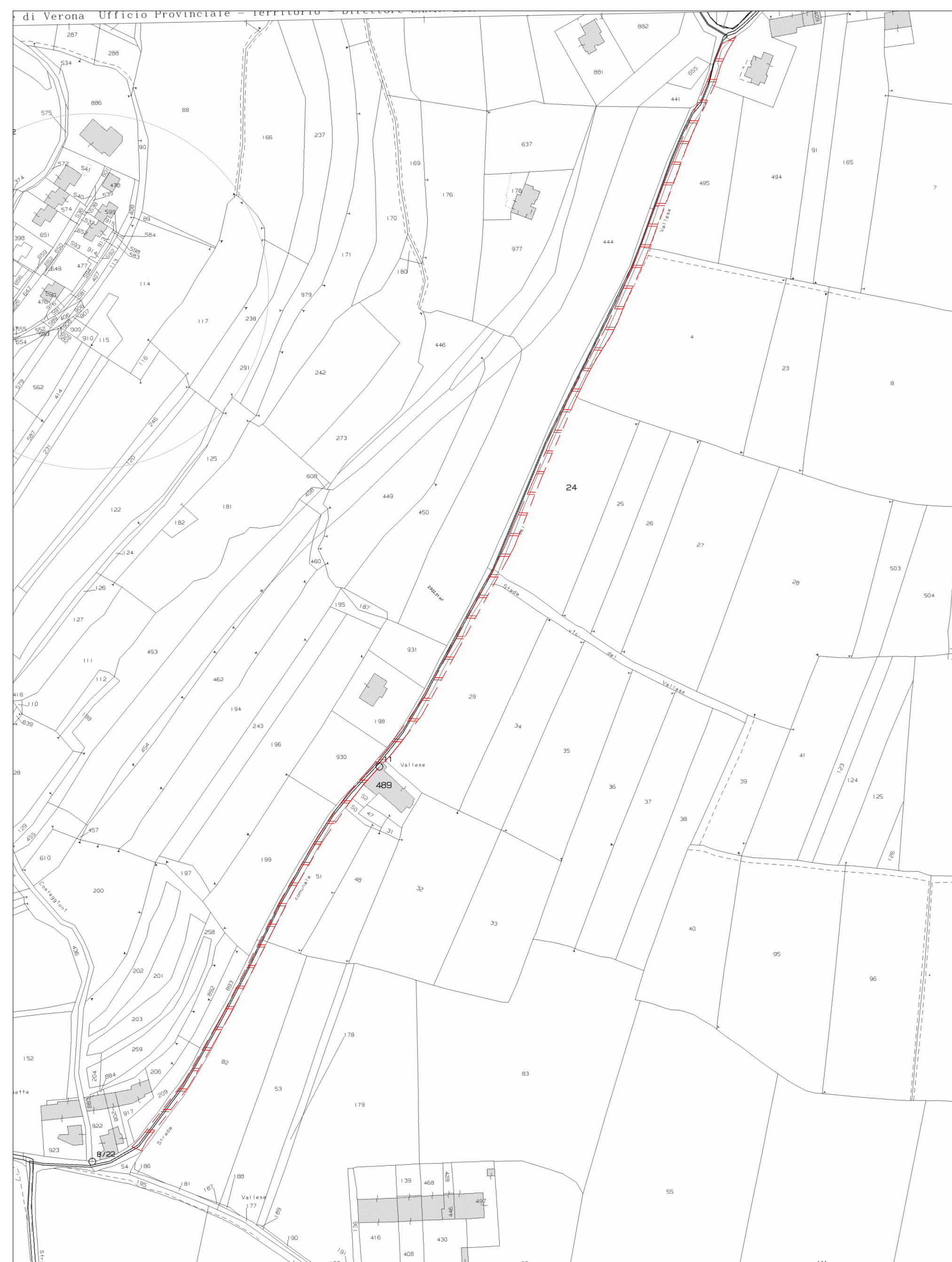
Estratto MAPPA CATASTALE Foglio 26 Comune di Cognola ai Colli Scala 1:2000